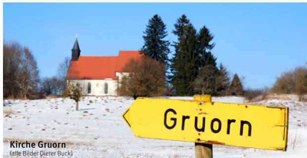
Kirche Gruorn

Wir erleben bei diesem Spaziergang die weite Landschaft des ehemaligen Truppenübungsplatzes, sehen in dem ehemaligen Dorf Gruorn die alte Schule und die Kirche.