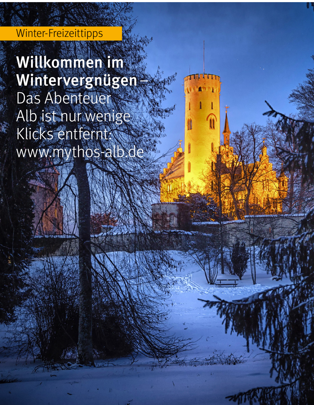
Titelbild: Langlaufen bei Ehestetten

Willkommen im Wintervergnügen – Das Abenteuer Alb ist nur wenige Klicks entfernt: www.mythos-alb.de