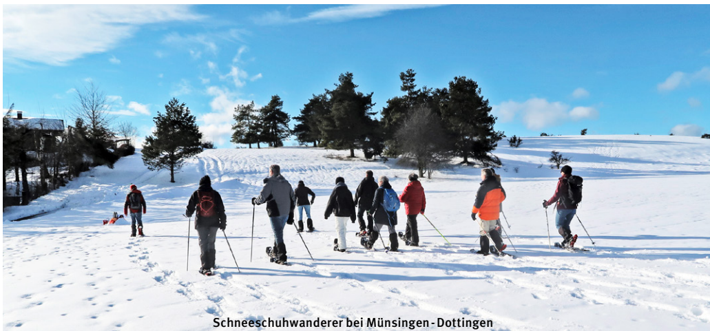
Schneeschuhwanderer bei Münsingen - Dottingen