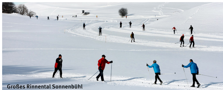
Großes Rinnental Sonnenbühl