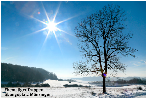
Ehemaliger Truppenübungsplatz Münsingen

Rad- und Wanderkarte Mittlere Schwäbische Alb, Maßstab 1 : 35.000, 8,90 Euro. Erhältlich bei den lokalen Tourist-Informationen sowie im lokalen Buchhandel.